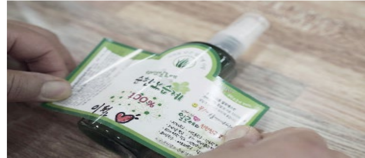
알로에 순한 보습제 만들어 피부건강 활용