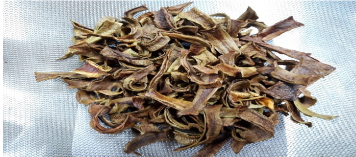
건조한 후 분말이나 차로 활용