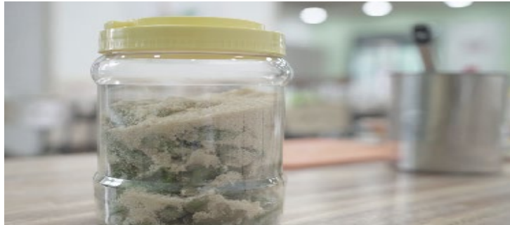
알로에 청 (효소) 만들어 음식 활용