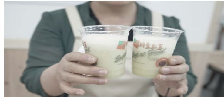
알로에 상큼 과일 주스 만들기